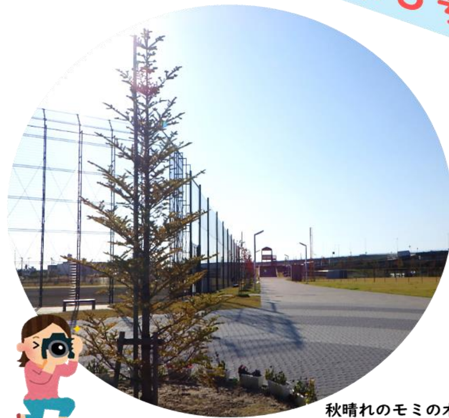
秋晴れのモミの木